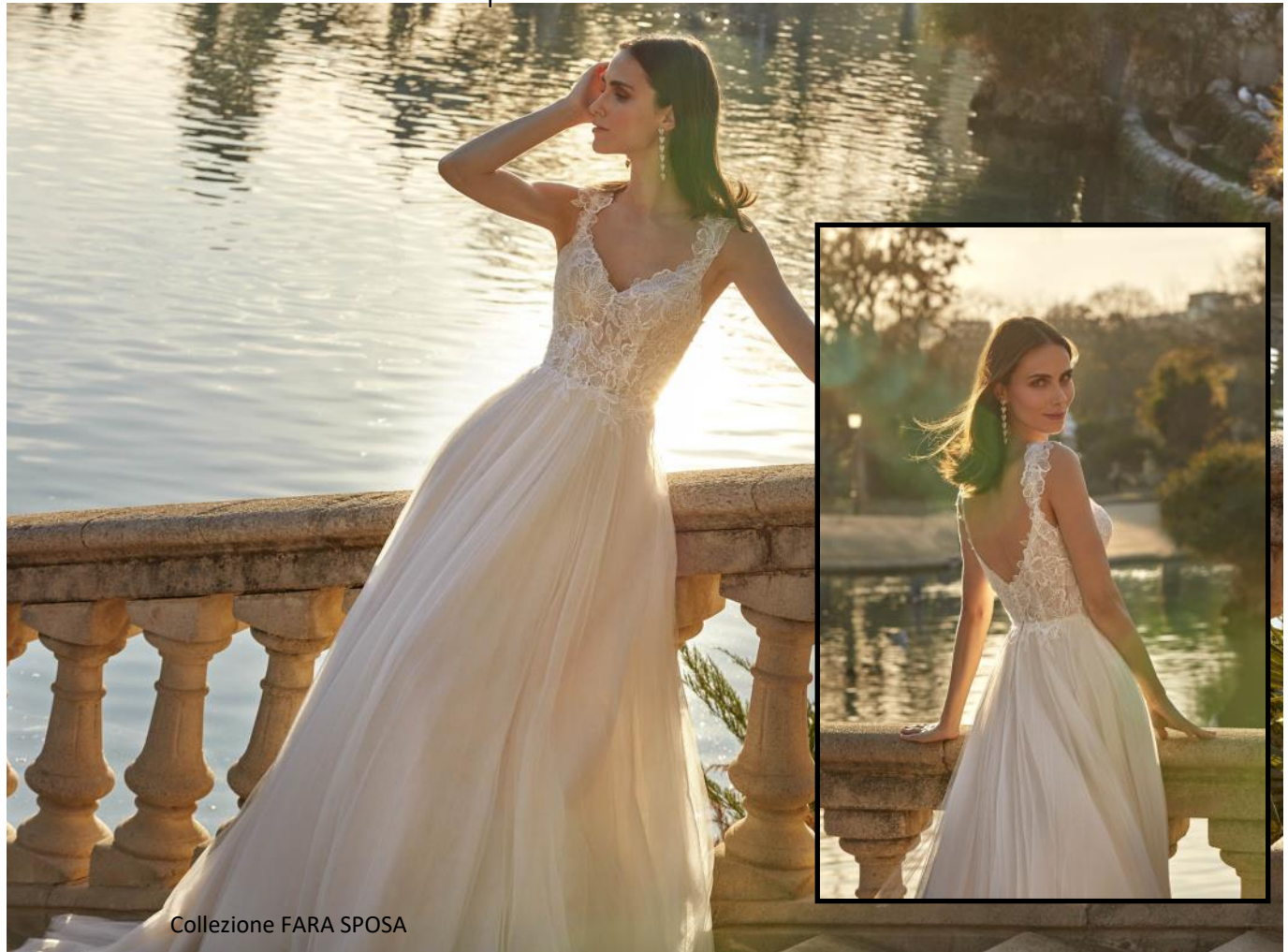
Collezione FARA SPOSA